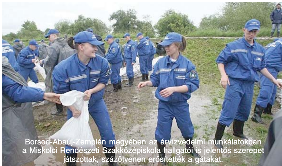
Borsod-Abaúj-Zemplén megyében az árvízvédelmi munkálatokban a Miskolci Rendészeti Szakközépiskola hallgatói is jelentős szerepet játszottak, százötvenen erősítették a gátakat.

A rendőrök, a tűzoltók és a katasztrófavédelem munkatársai nemcsak hétköznapi feladataikat illetően álltak helyt a kritikus napokban Borsod-Abaúj-Zemplénben, hanem legénynek bizonyultak a gátakon is, ahol a lakosság és a vízügy munkatársai mellett komoly erővel vettek részt az árvízvédelmi munkálatokban. Vállvetve dolgoztak az árvízvédelmen katasztrófavédelem, tűzoltóság, rendőrség, a speciális mentőszervezetek emberei, de ott voltak velük az érintett lakosok, társadalmi szervezetek képviselői és a legkülönbözőbb helyekről érkező önkéntesek.