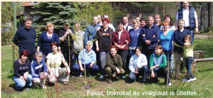
Fákat, bokrokat és virágokat is ültettek...