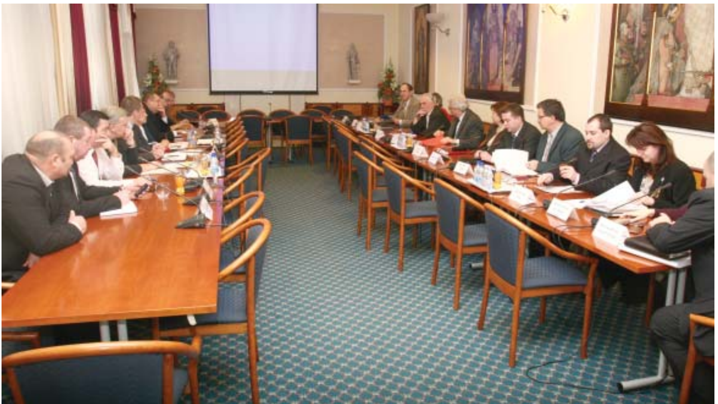
Szakszervezeti vezetők, kormányzati képviselők tárgyalásairól szóló beszámolóink lapunk 5–10. oldalán