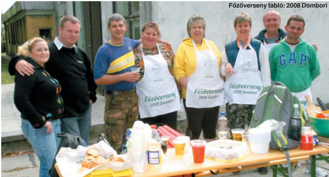
Főzőverseny tabló: 2008 Dombori

küzdelembe, és varázslatos dolgokat produkáltak. De a fővárosiak harcspaprikás-túrós csusza együttese után is megnyalhatta bárki mind a tíz ujját, s akkor még számtalan csodát – sértődés ne essék – nem is említettem.