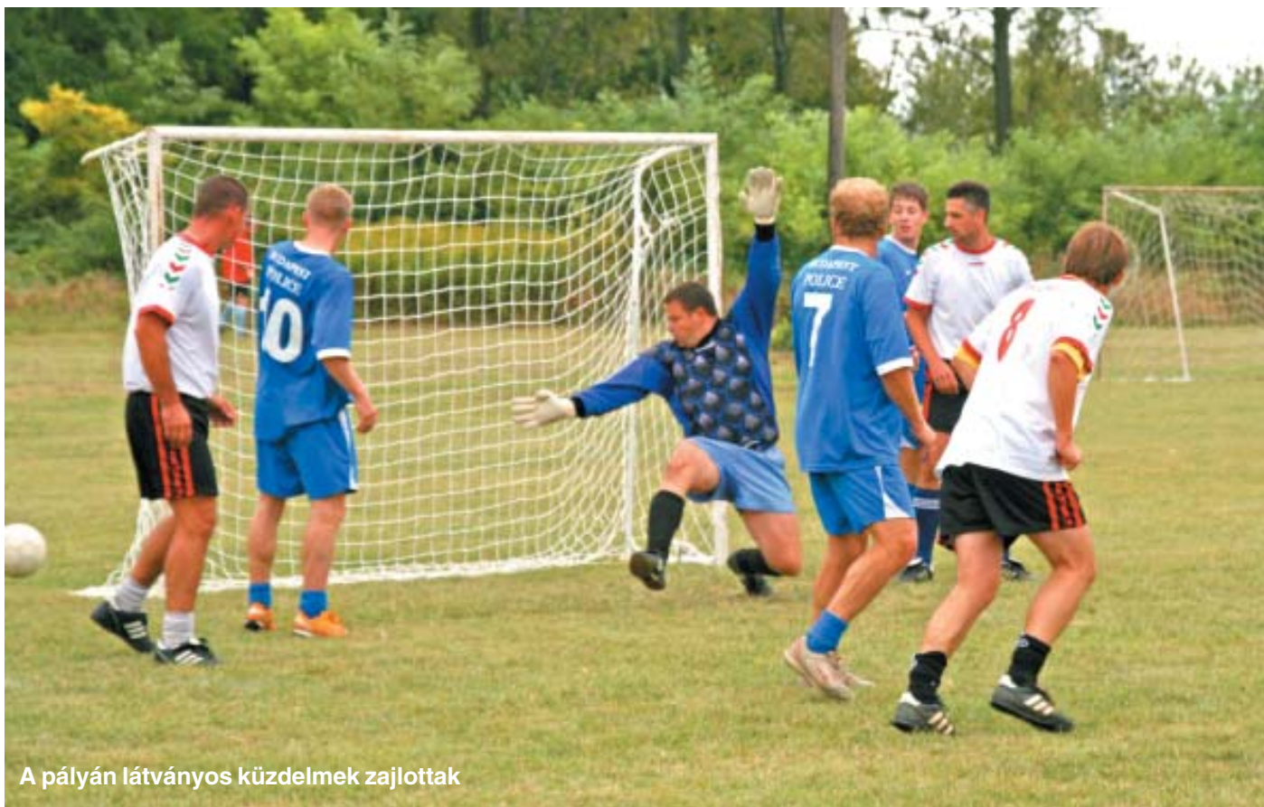
A pályán látványos küzdelmek zajlottak

→ latos, varázslatos vagy eszméletvesztő. Mert ilyen fokozatokkal érzékeltethetők csupán az elkerülhetetlen különbségek.