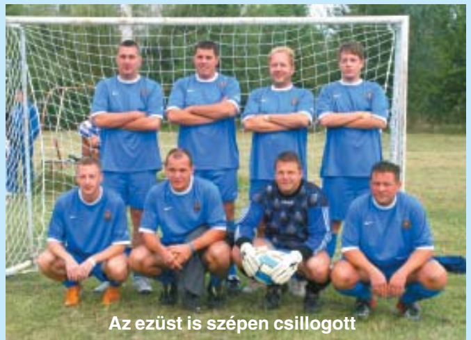
Az ezüst is szépen csillogott