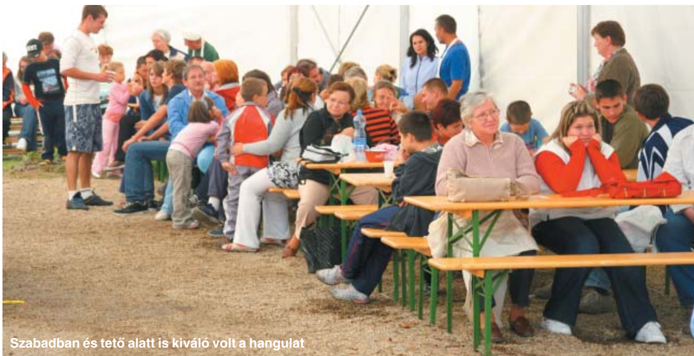
Szabadban és tető alatt is kiváló volt a hangulat

Ez már délután volt, amikor a csapatok az étterembe vitték készítményeiket, hogy a tekintetes zsűri sorra megkóstolja, és megbírálja azokat. Most nem hallottam, hogy a fősfé feleségül kért volna valakit – tavaly félig nyíltan egy étkebe merítve nyelvét, ezt tette –, de azt tanúsíthatom, ismét egyik ámulatlából a másikba esett, s bírátsái sem cselekedtek másképp. Kutya nehéz dolog volt a közel harminc adag közül sorra venni, melyik volt jó, még jobb, csodá- ➔