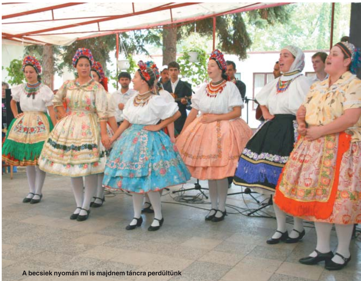
A becsiek nyomán mi is majdnem táncra perdültünk