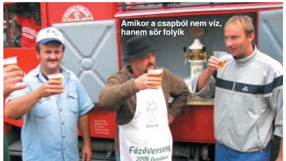
Amikor a csapból nem víz, hanem sör folyik