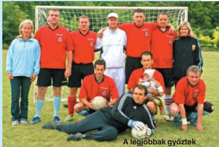
A legjobbak győztek