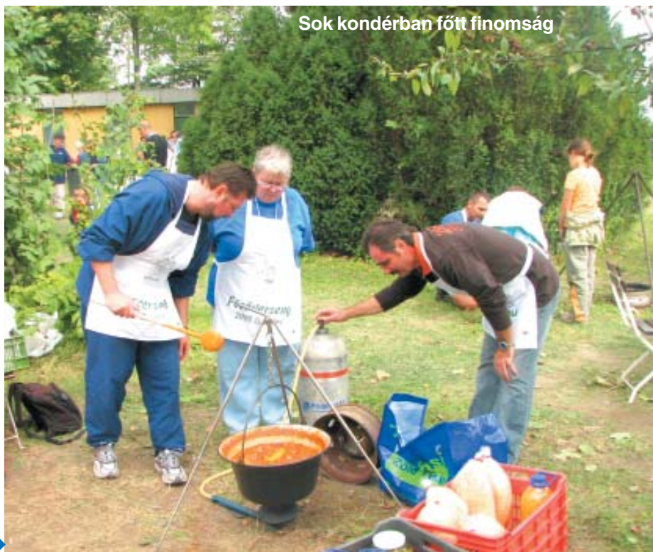
Sok kondérban főtt finomság

Viszonylag nagyobb nyüzsgést az eredmények hivatalos kihirdetése váltott ki, amikor nem volt ritka az éljen, a huj, huj, hajrá, s ehhez hasonlatos örömfelkiáltások. A terepen pedig mindenki régóta körbejárt, az emberek a mások étkeit, italaik kóstolgatták, és remekül el voltak egymással. Ezt látva fogalmazódott meg bennem: biztos, hogy nekik nem is a kupa meg a díjak igazán fontosak, hanem éppen ezek a találkozások. Hogy a nyírségi vagy zempléni katasztrófa itt találkozhatott az ország másik szegletéből érkezett kollégájával, ez mindennél többet ért, számított. Nna, ezért (is) kell újra és újra ilyen bulikat →