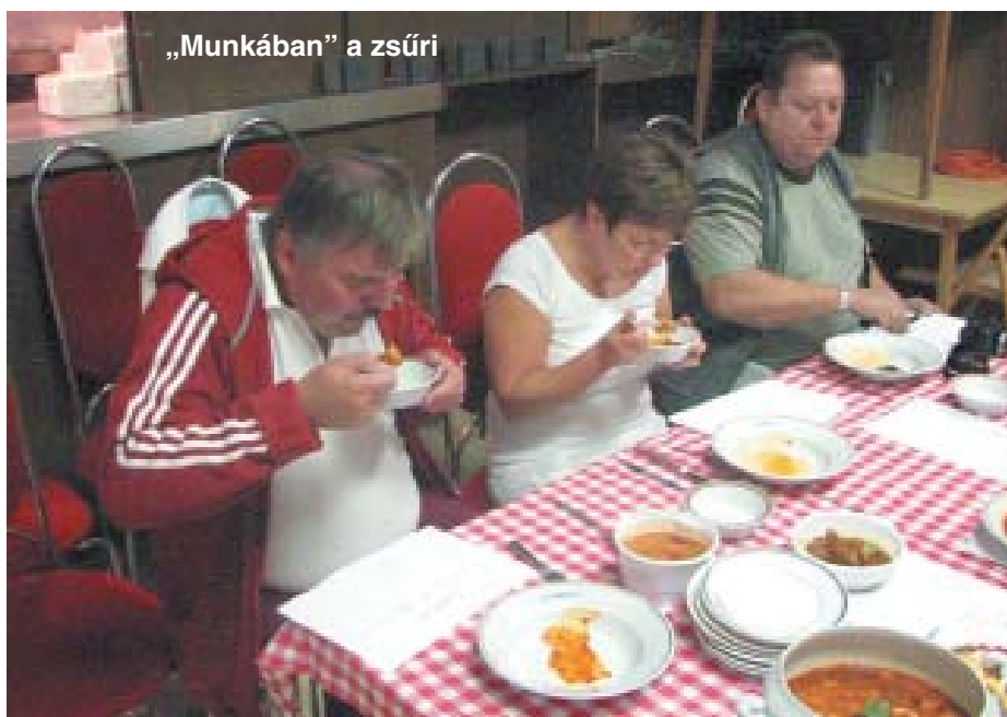
„Munkában” a zsűri

harapnivalókat is kapni, szóval szerencsére nemigen látok szomorú arcokat.