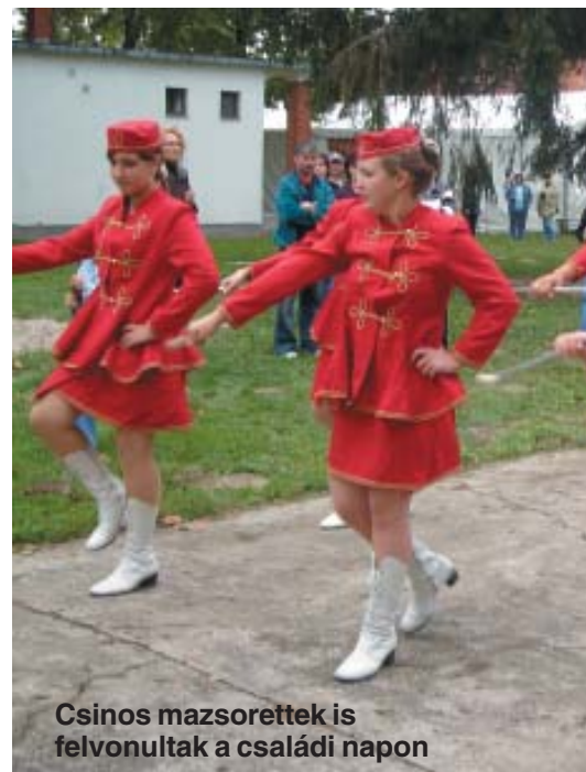
Csinos mazsorett is felvonultak a családi napon