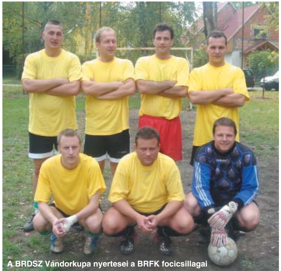
A BRDSZ Vándorkupa nyertesei a BRFK focicsillagai

Mit szólsz? Számítottál rá? Mit gondolsz, miért te? Ezeket a kérdéseket mindhármuknak felteszem, a másodikra nem a válasz, az elsőre és a harma-