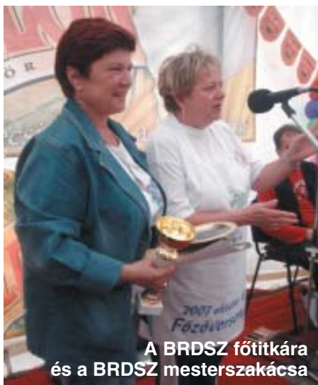
A BRDSZ főitkára és a BRDSZ mesterszakácsa

zetünk! – kiált az arcomba, s most, hogy már tudom a lényegét, hagyom drukkolni. Másik társát faggatom, mire számít, s ő így felel: – Jók vagyunk, nyerünk.