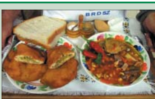
Az I. helyezést elért kisalföldi bújdosóleves körettel

túl rengeteg értékes nyerménnyel távozhattak a résztvevők. Kisorsoltak értékes festményeket, egyhetes gyermektáborozási lehetőséget, wellness-hétvégén való részvételt, étkezést is tartalmazó egynapos wellness-fürdön való részvételi lehetőséget, gyertyafényes vacsorát, gumibroncs szerelést, mozi- és színházjegyeket, csemegekosarakat, szötteket, különleges női vállkendőket, kaktuszokat, kerámiákat, palackozott borokat, plüssfigurákat, tea-főzőt, turmixgépet, étkezési utalványt, illatszereket.