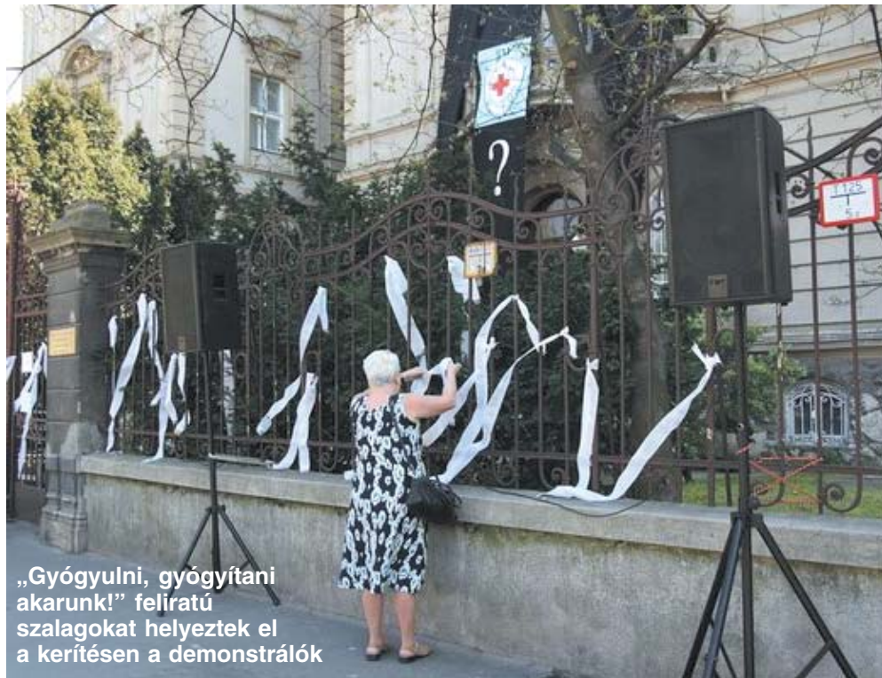
„Gyógyulni, gyógyítani akarunk!” feliratú szalagokat helyeztek el a kerítésen a demonstrálók

meghallottam a kórházreformról szóló híreket meg sem fordult a fejemben, hogy ezt a telephelyet teljesen megszüntethetik. Elfogadhatatlannak tartom továbbá azt is, hogy integrációra hivatkozva a miniszter urak jogot formáljanak az itt dolgozó emberek életkörülményeinek ellehetetlenítésére.